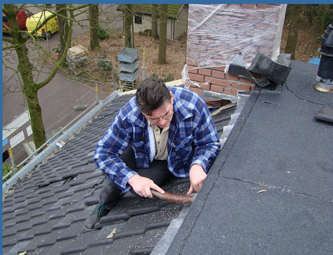
Een vrijwilliger op het dak aan het werk. Op de achtergrond ziet u één van de twee nieuwe gemetselde schoorstenen

Zaterdag 8 mei van 10-12 uur Inlooptend om het "bijna-" "eindresultaat te zien! Komt u/jij ook!?