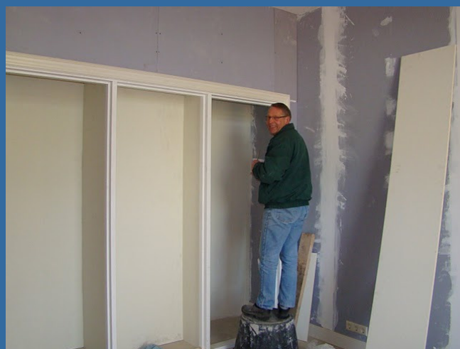
Ieder spijkergaatje wordt onzichtbaar weggewerkt...

U wilt nog meehelpen of wilt graag meer informatie? Neem dan contact op met Nico Klok of Gert Schalk. En kom natuurlijk even op 8 mei 's ochtends kijken tijdens ons open huis!