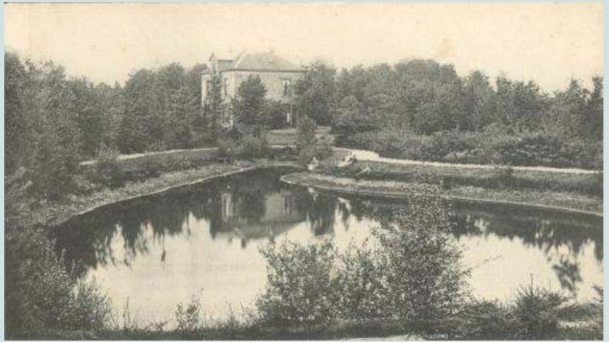
Pastorie en tuin met vijver uit begin vorige eeuw, circa 1905

Naast uw bijdrage in geld of arbeid willen we ook vragen om dit project in uw gebeden te gedenken.